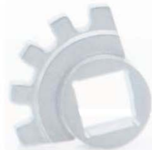
13. Детали с дополнительной механообработкой.